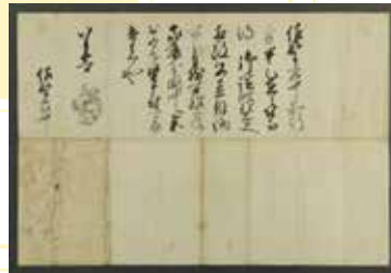
徳川家康黒印状：小田原攻め後、関東入りした家康の分国が佐野領に隣接していたことがわかります。