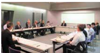
令和6年度定時評議員会風景