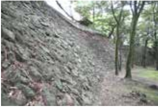
8mを超える安土桃山時代の高石垣

山頂から山麓にかけて城郭遺構が良好に残る、194haを超える広大な面積を有した関東屈指の山城。平成26年に国指定史跡に指定。