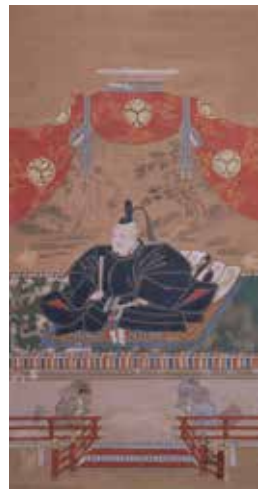
徳川家康画像：栃木県立博物館の所蔵品です。