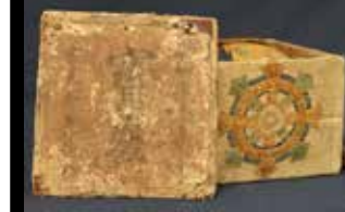
旧家の蔵から近年発見された天命「宝釜」を初公開します。茶釜の吊り鎖には、佐野氏の祖が源平合戦で平氏から賜ったと伝わる揚羽蝶の飾り金具が付いています。