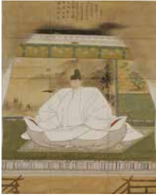
豊臣秀吉画像：東京大学史料編纂所所蔵の模写画像で、縦 129 cm × 103 cmの大きさがあります。