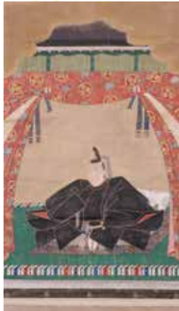
徳川秀忠画像：東京大学史料編纂所所蔵の模写画像です。