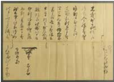
徳川秀忠書状：秀忠の大軍が関ヶ原へ向かう途中、佐野に寄ってもてなしを受けたことがわかります。